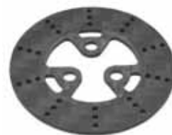
ハブ部に取付け可能なオプション のカーボンブレーキディスク (7月発売予定)